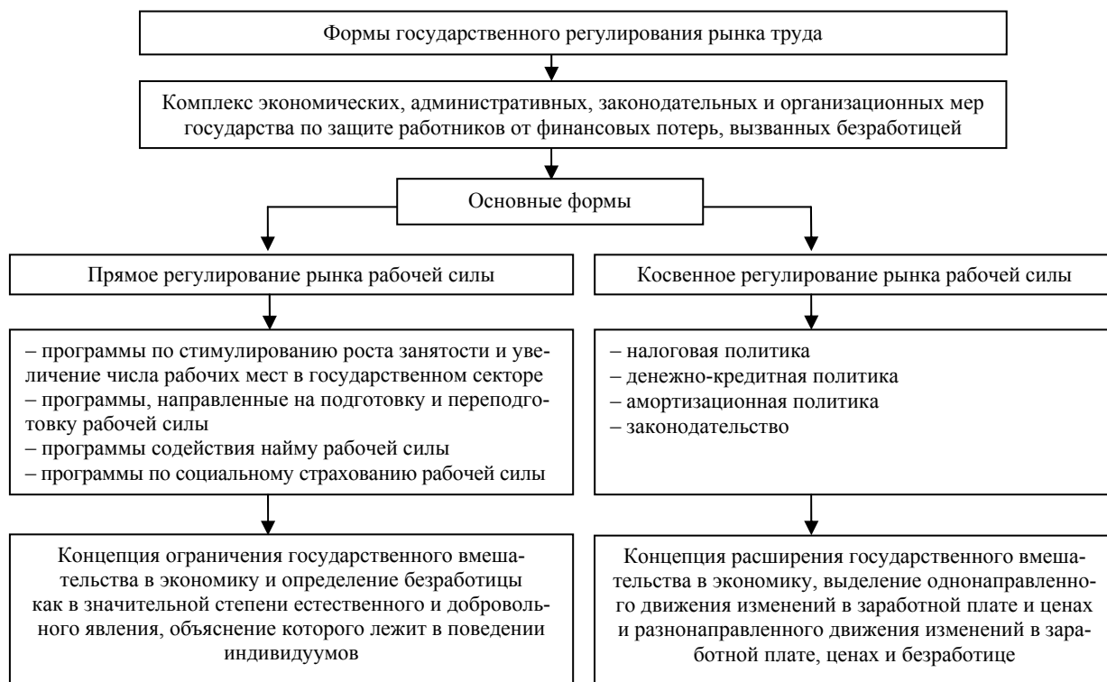
Рис. 2. Формы государственного регулирования рынка труда [4]

В зависимости от цели и задач регулирования государство выбирает методы и инструменты воздействия на рынок труда (рис. 2).