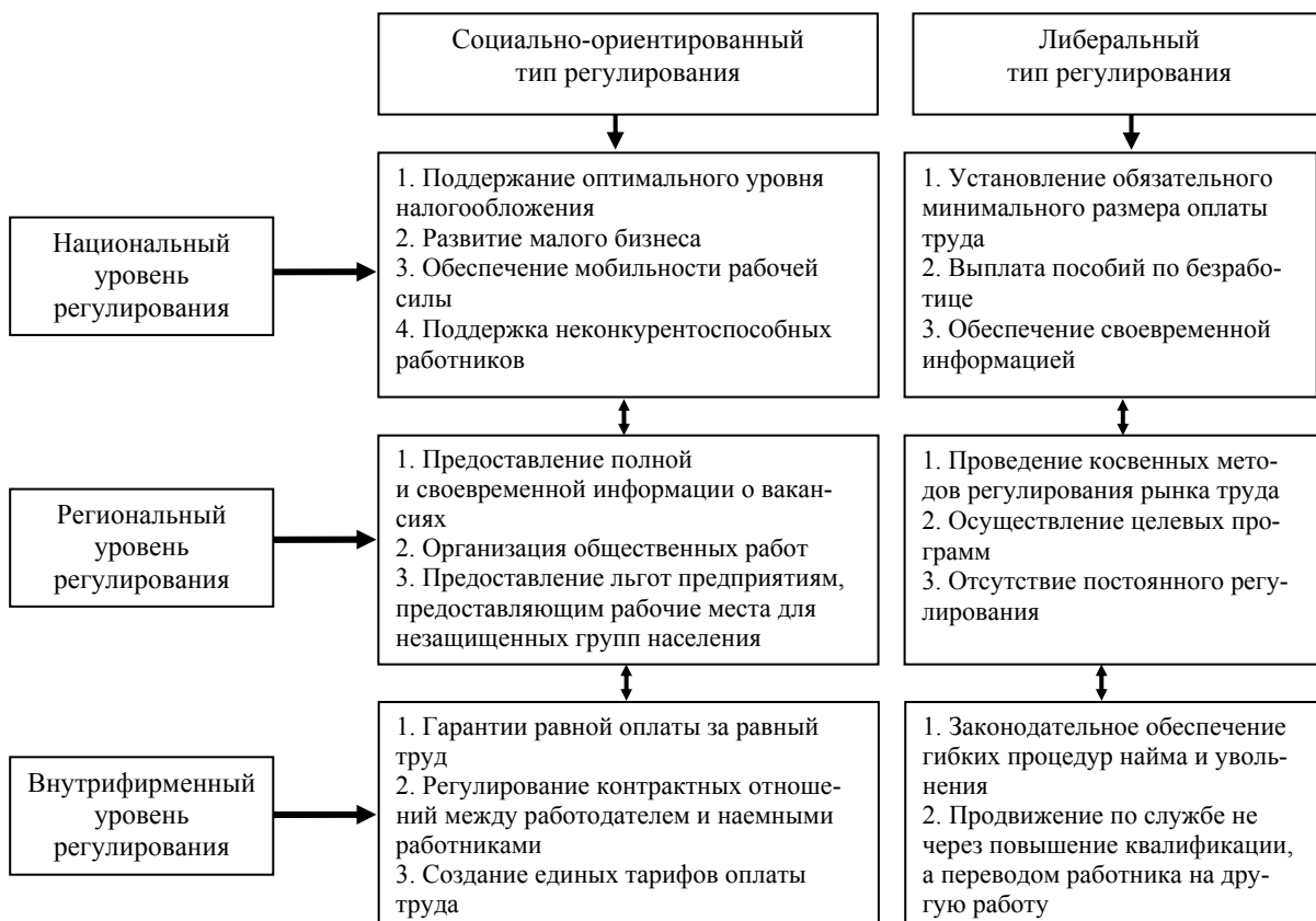
Рис. 1. Уровни государственного регулирования рынка труда [4]

Государство определяет основные направления политики на рынке труда, которые реализуются на различных уровнях регулирования. Так, регулирование рынка труда характеризуется следующими мероприятиями государства (рис. 1).