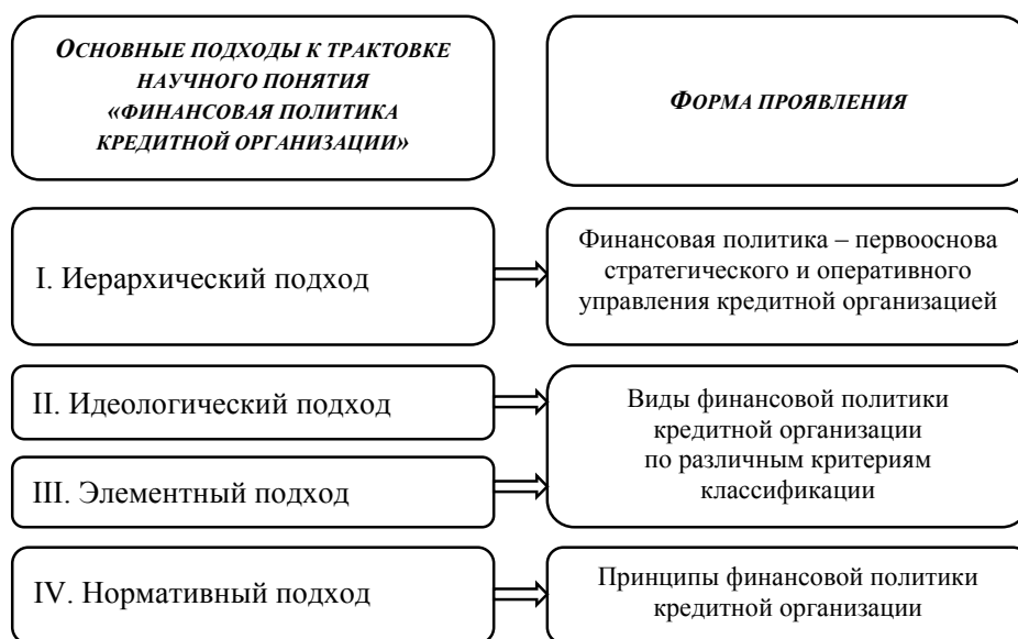
Рис. 2. Формы проявления основных подходов к трактовке научного понятия «финансовая политика кредитной организации»

I. Иерархический подход дает понимание системы финансового управления деятельностью кредитной организации как единства трех уровней – политики, стратегии и оперативного управления. При этом финансовая политика выступает первоосновой процесса стратегического и оперативного управления деятельностью любой кредитной организации [1, с. 75–77; 2, с. 313–315].