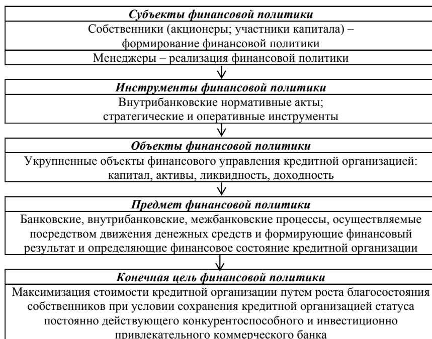
Рис. 1. Механизм финансовой политики кредитной организации

области финансовой деятельности кредитной организации (рис. 1).