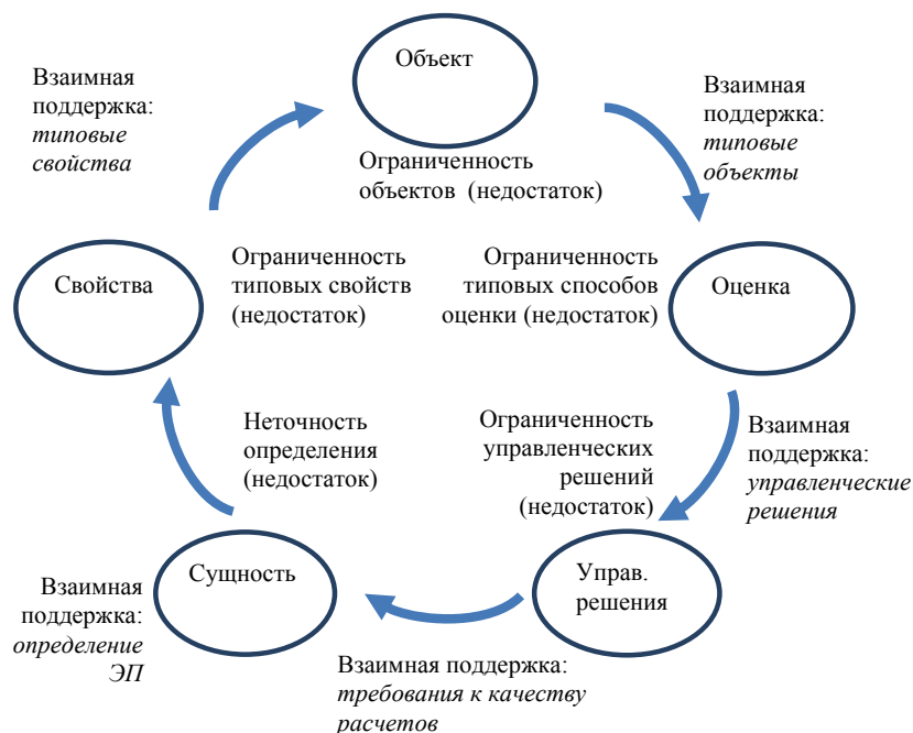
Рис. 1. Циклическая конструкция