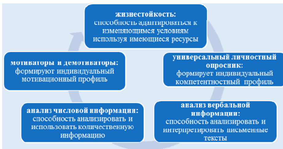
Рис. 1. Базовые инструменты диагностики (сост. на основе материалов платформы АНО «Россия страна возможностей»)

В структуре теста содержалось десять базовых инструментов диагностики когнитивных способностей и личностного потенциала: пять базовых (рис. 1) и пять дополнительных (см. рис. 2). База методологии – «конструктор компетенций», оценка производилась по индикаторам, использовалась шкала т-баллов, где 200 – минимальный, 500 – средний, а 800 – теоретически максимальный т-балл. Результаты переводились в трехуровневую шкалу – начальный, средний и высокий уровни проявления компетенций.