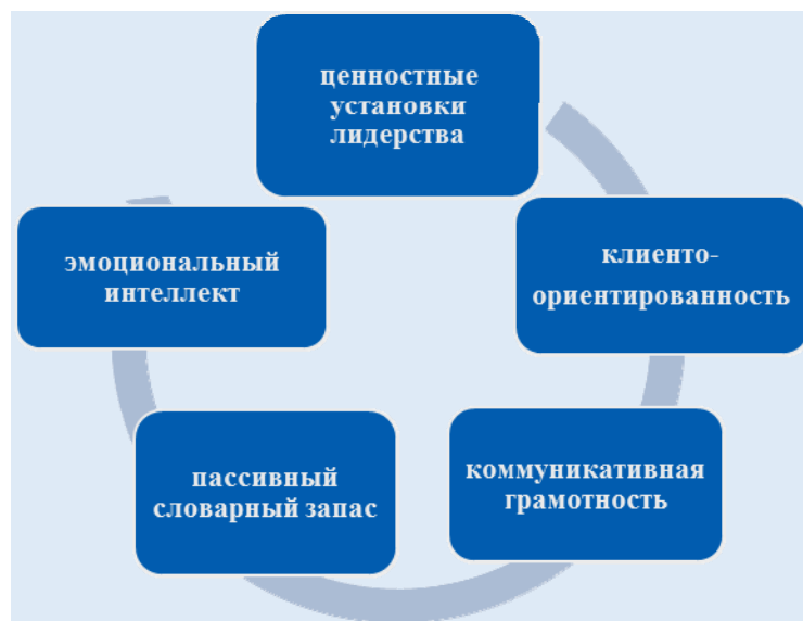
Рис. 2. Дополнительные инструменты диагностики (сост. на основе материалов платформы АНО «Россия страна возможностей»)