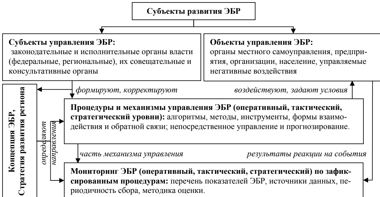
Рис. 1. Основные элементы системы управления ЭБР [11, с. 267; 12, с. 103]

Обобщая проведенный обзор, отметим, что ввиду широкой проблематики, применяемые механизмы управления безопасностью и процедуры мониторинга следует соотносить с разными уровнями управления (рис. 1).