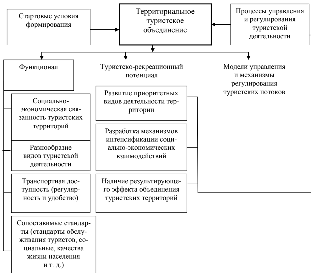
Рис. 1. Модель функционально-управленческой структуры территориального туристского объединения